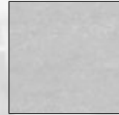
Flooring shown after exposure to light.