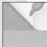
Plancher avec & sans pellicule de séchage.