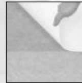
Piso mostrado con y sin efecto ambar