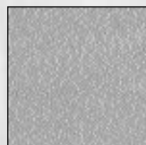
Plancher avec pellicule de séchage.