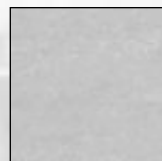
Plancher vu après exposition à la lumière.