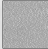
Flooring with ambering.