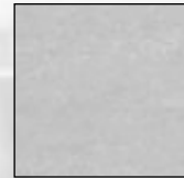
Piso mostrado despues de expuesto a la luz